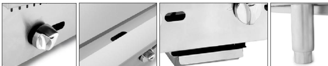
Patas de acero inoxidable